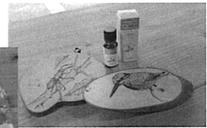
ウッドバーニング